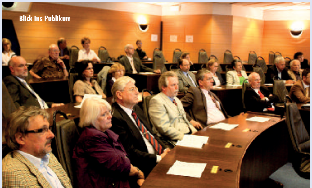
Blick ins Publikum